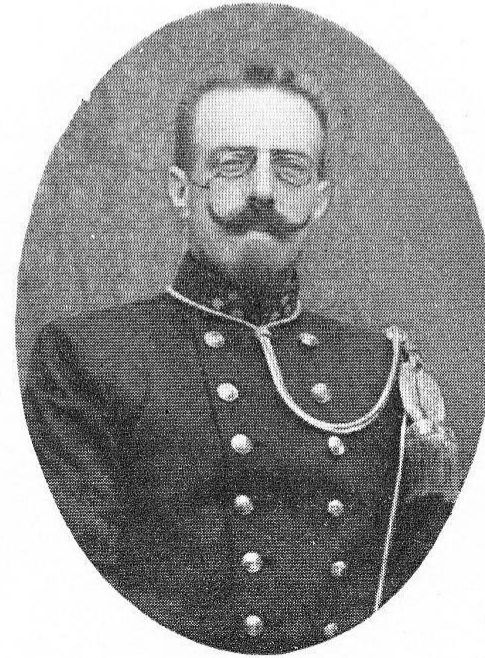
LAHAISE, Hubert-Joseph, né le 3 août 1870, à Hollain.

Brillant officier, tomba glorieusement le 24 août 1914, au cours de la défense du château d'Impde, violemment attaqué par les Allemands.