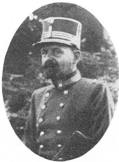
SWEERTS, Jean-Paul, né le 1 er avril 1869, à Anvers.

Se distingua par sa bravoure, à la bataille de Haelen, le 12 août 1914, tomba au Champ d'Honneur, en défendant la tête de pont, au nord de Dixmude, le 12 juin 1915.